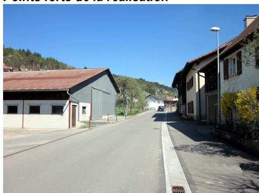
Rue Les Voirdgerats après réaménagement