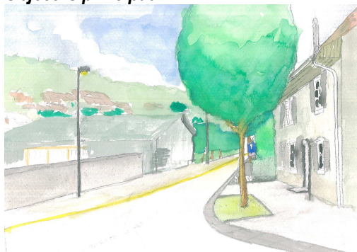
Perspective de la Rue Les Voirdgerats