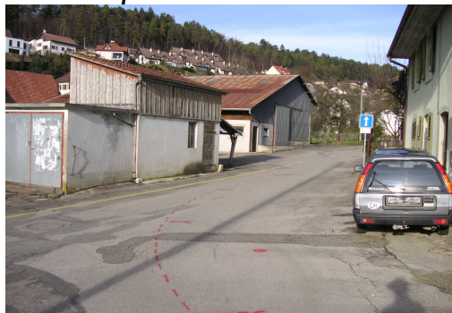
Rue Les Voirdgerats avant les travaux