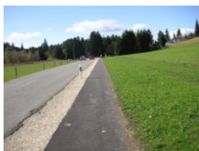
Réalisation du cheminement entre les villages