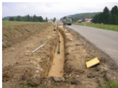
Pose de la conduite d'eau potable