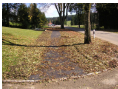
Réalisation du cheminement à l'entrée de Lajoux