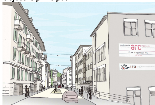
Perspective projetée de l'entrée dans le centre de Saint-Imier